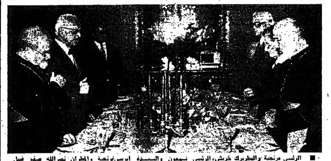
الرئيس بركة خورشى الرئيس سمون والسيدة ايريس نونجه والخران نمرالله صيفر قبل الغداء في القصر امس

بدأ مجلس النواب أمس ، مناقشة وتقييم الأوضاع العامة ، في ضوء بيان رئيس الحكومة ، ويستهدف هذه المناقشة اليوم ، اذا تيسر له الاجتماع . وأمام الـ ٤٠ نائباً الذين حضروا الجلسة ، عبر الرئيس كرامي عن حالة تفائل وهو يحفظ ، عندما قال : ان لبنان اليوم متمسك بوحدته ووحدة أرضه وشعبه ، متمسك بسيادته واستقلاله ، وهو لا يمكن ان يتسلل اليه ما لا يريد ، وما لا نيل به . ان يتعرض في كرامته ، او في الأمن التي ارتضيها ، لا يخطر بؤدي به . وأطلب رئيس الحكومة بالمثل من اجل تأمين الأسباب الكفيلة بان تمديد الاستقرار والهدوء ، وقال : اتسي اعتبر الحوادث الأخيرة من نسيول الانتحال الشليل ، واذاً ما حستبت التواكب ، ونفعل الأداة الشرسية ، فاننا ننتسب ان نقول باننا قد وصلنا او شارفنا على نهاية هذه الأزمة السوداء .